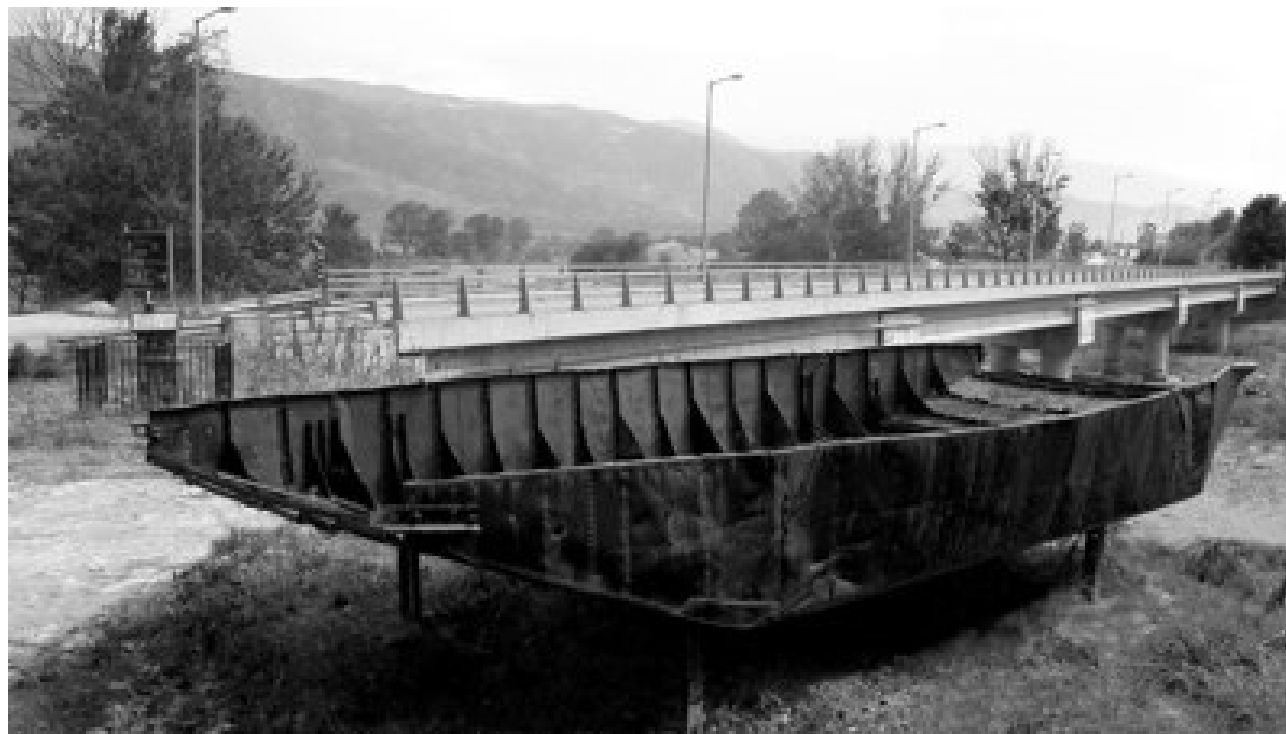
Εικ.2. Ένα σιδερένιο καράβι σαν της Γούνιτσας, όπως είναι σήμερα εκθεμένο στην διασταύρωση της επαρχιακής οδού Μακροχωρίου - Παραποτάμου – Γόννων, μετά την μετακίνησή του στην περιοχή αυτή, γύρω στο 1937.